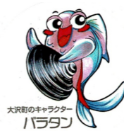
大沢町のキャラクター パラワン

春間近か、感動のオリンピックも終わり、冬眠から急いで目覚め新年度に向け活動発信スタートさせましょう。仲間互いの絆確かめ合って、声を掛け合います。春にふさわしい精いっぱい笑顔で。(Y.O記)