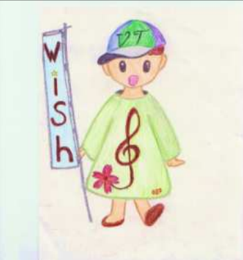
27年度大沢中学校卒業生によって生まれた希望の象徴キャラクター「ウィッシュ」さん