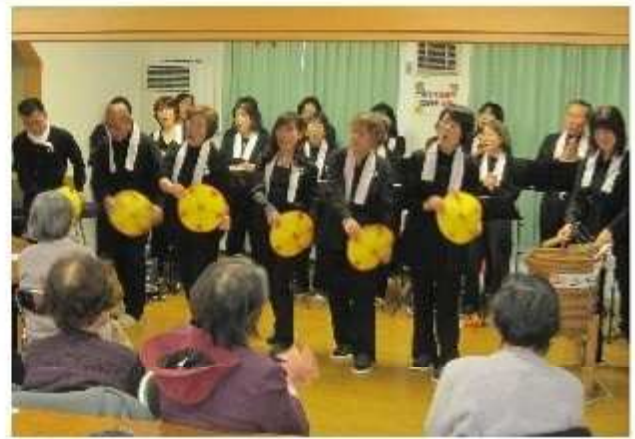
3月6日ふれあい喫茶 Doコーラス

大沢児童館の庭の桜の蕾が膨らんできました。桜の花が咲くには何度か冷え込まないと綺麗な花を咲かせないそうです。さて、23年度も児童館では、子供達に健全な遊びの場や機会を提供すると共に、子育て支援機能の充実を図ります。又、地域との連携・交流を通し子供を見守り、育てて行きたいと考えています。このために、