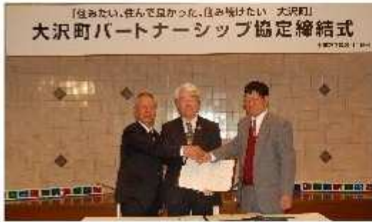
「住みたい、住んで良かった、住み続けたい 大沢町」 大沢町パートナーシップ協定締結式

さる3月19日(土)、FFPに於いて神戸市長のご出席をいただき「パートナーシップ協定」の調印式を行いました。地元、役所からの出席者の紹介の後、大沢町の課題と、今後取り組む具体的な方法を発表し、その後の調印式で協