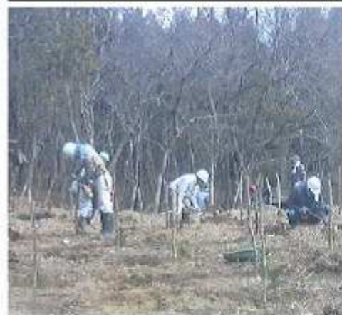
大沢町HP→神付産土の森→ブログ

3月13日神付産土の森の赤松広場で「神付産土の森の会」が県の助成を受けていただいたマツノザ