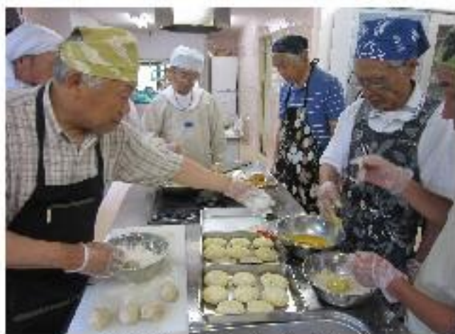
県民交流広場事業 男の料理教室 (ジャガイモ料理) 6月30日(水)