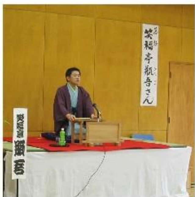
防災福祉コミュニティ-消防合同夏季訓練